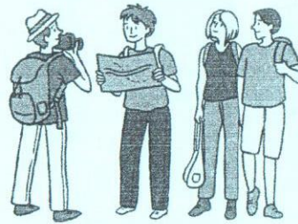
การท่องเที่ยว