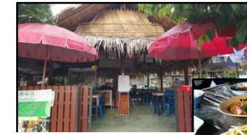
ร้านส้มตำแม่สอด ยะหา