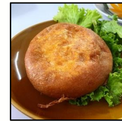
ร้านไข่ฟก ยะหา