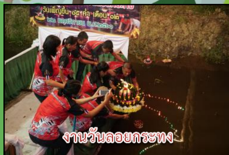
งานวันลอยกระทง