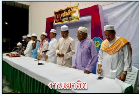
งานเมาลิด