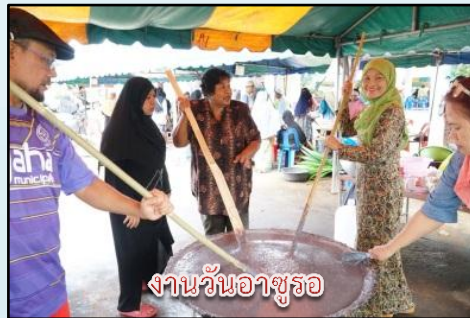
งานวันอาชูรอ