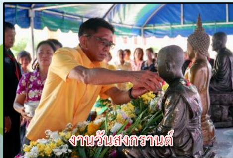
งานวันสงกรานต์